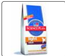
Canine Light Adult Chicken: Pytle 1 kg, 3 kg, 7,5 kg a 15 kg