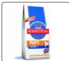
Canine Light Senior™ with Chicken: Pytle 3 kg a 15 kg