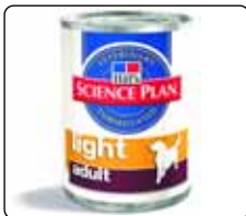
Canine Light Adult: Karton 12 konzerv 415 g